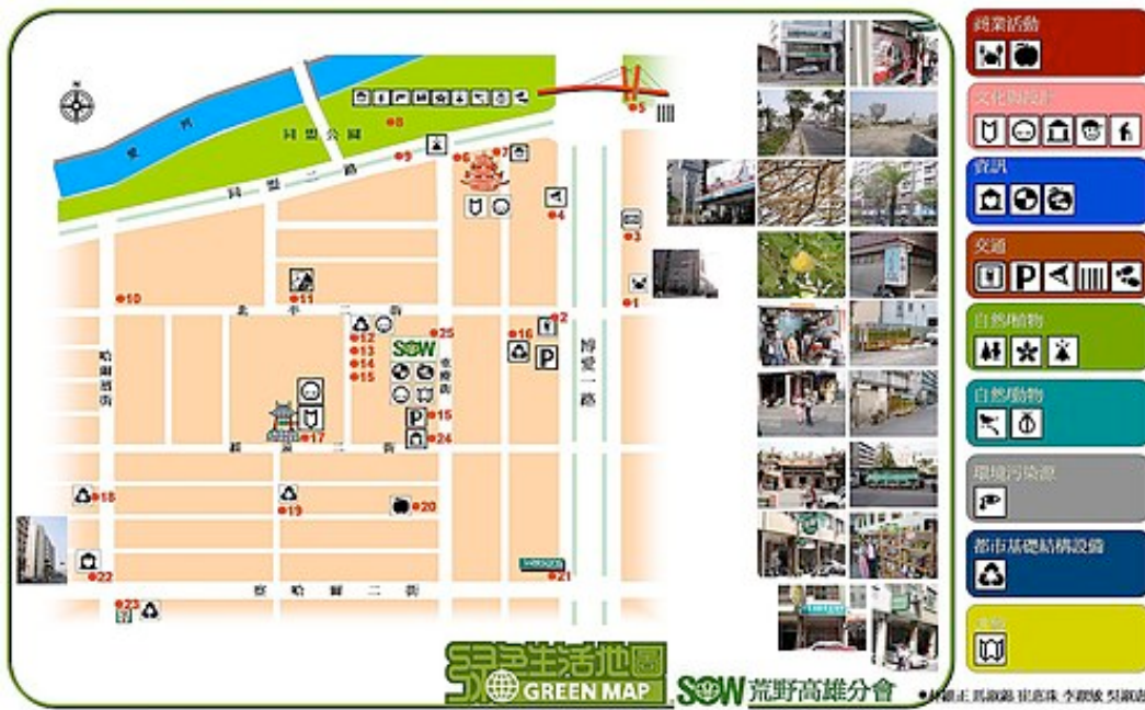
荒野高雄分會綠色生活地圖

希望凡有綠繡眼飛過的地方，都能將綠色遍灑於每個角落，讓散置於各角落的綠，能組織成一幅完整完美的綠色生活地圖。