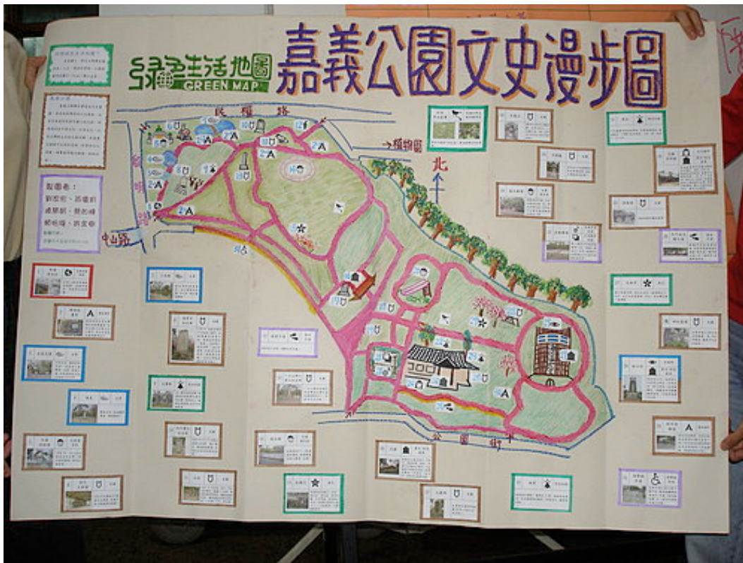
嘉義公園綠色生活地圖