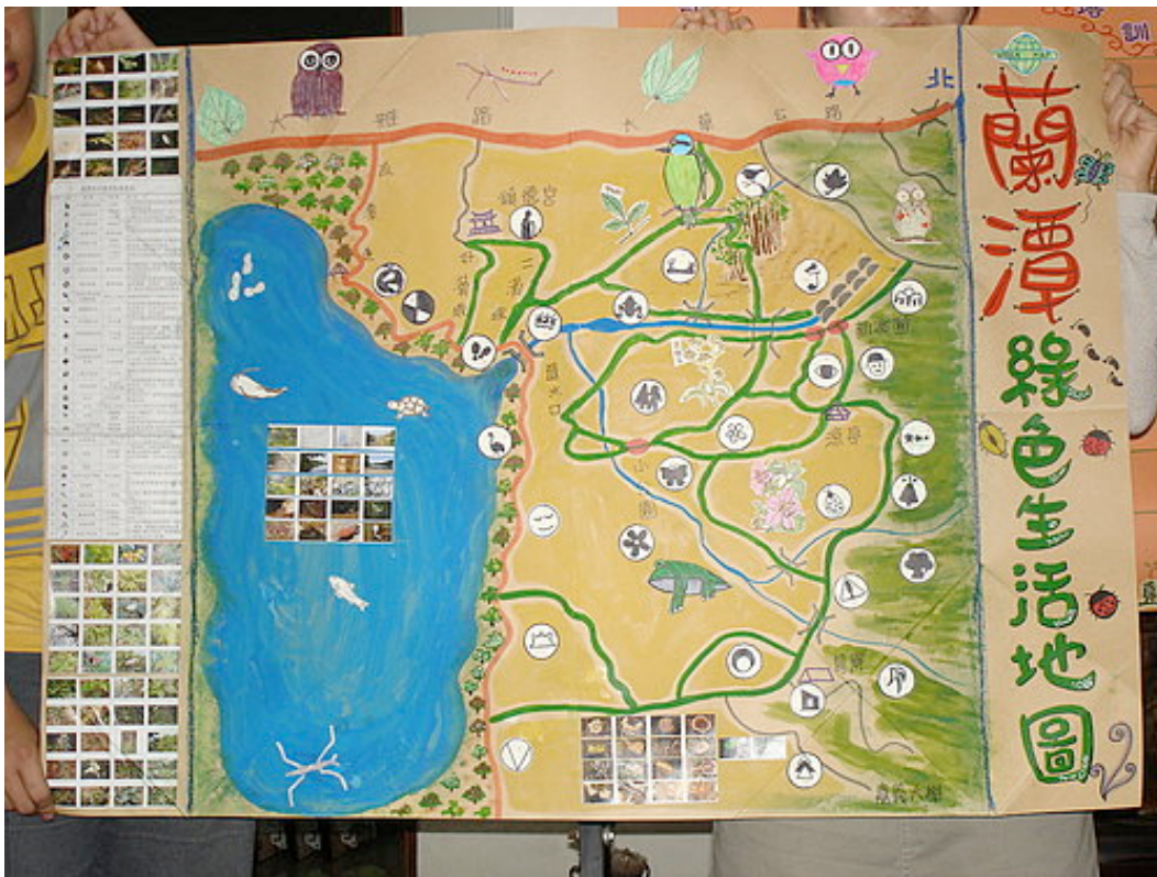
嘉義蘭潭綠色生活地圖